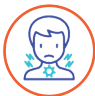
falta de aliento